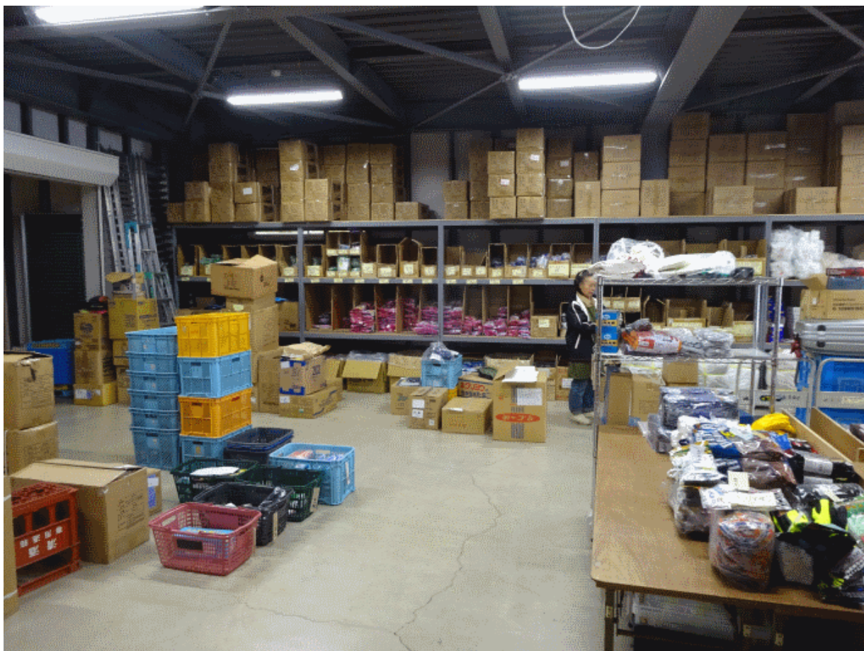
- склад перчаток компании «Aoi Works»