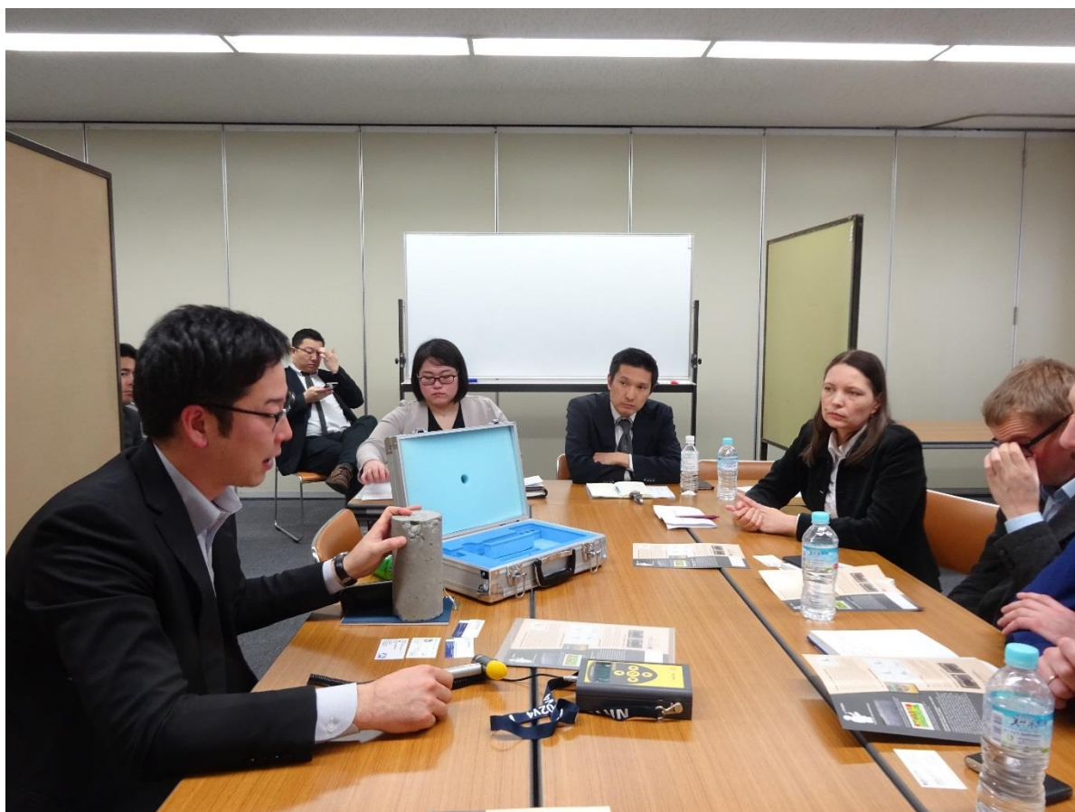
- на переговорах