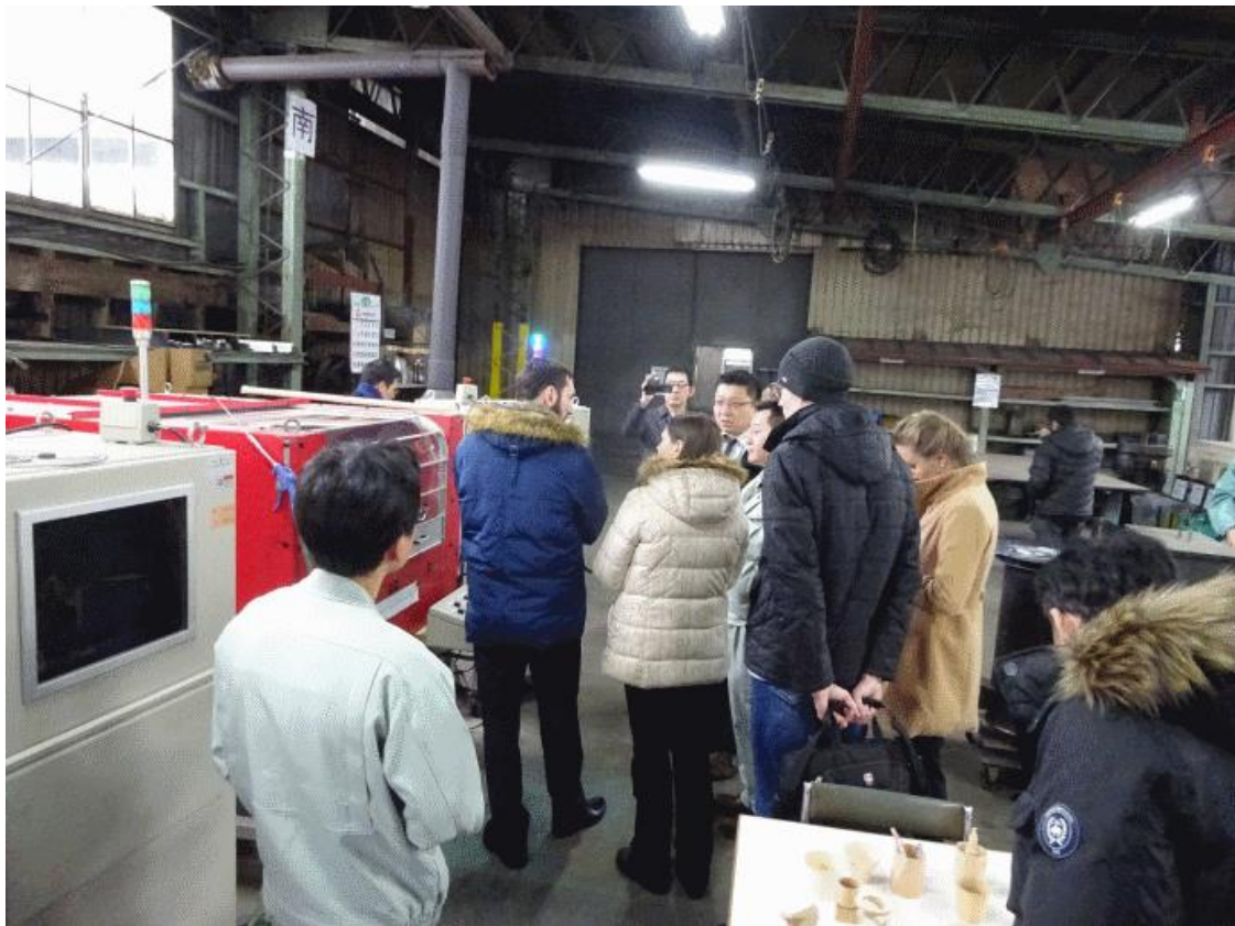
- станкостроительный завод в г.Асахикава