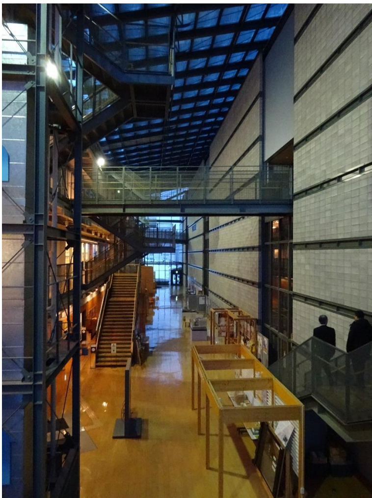
- институт комплексных исследований в г.Асахикава