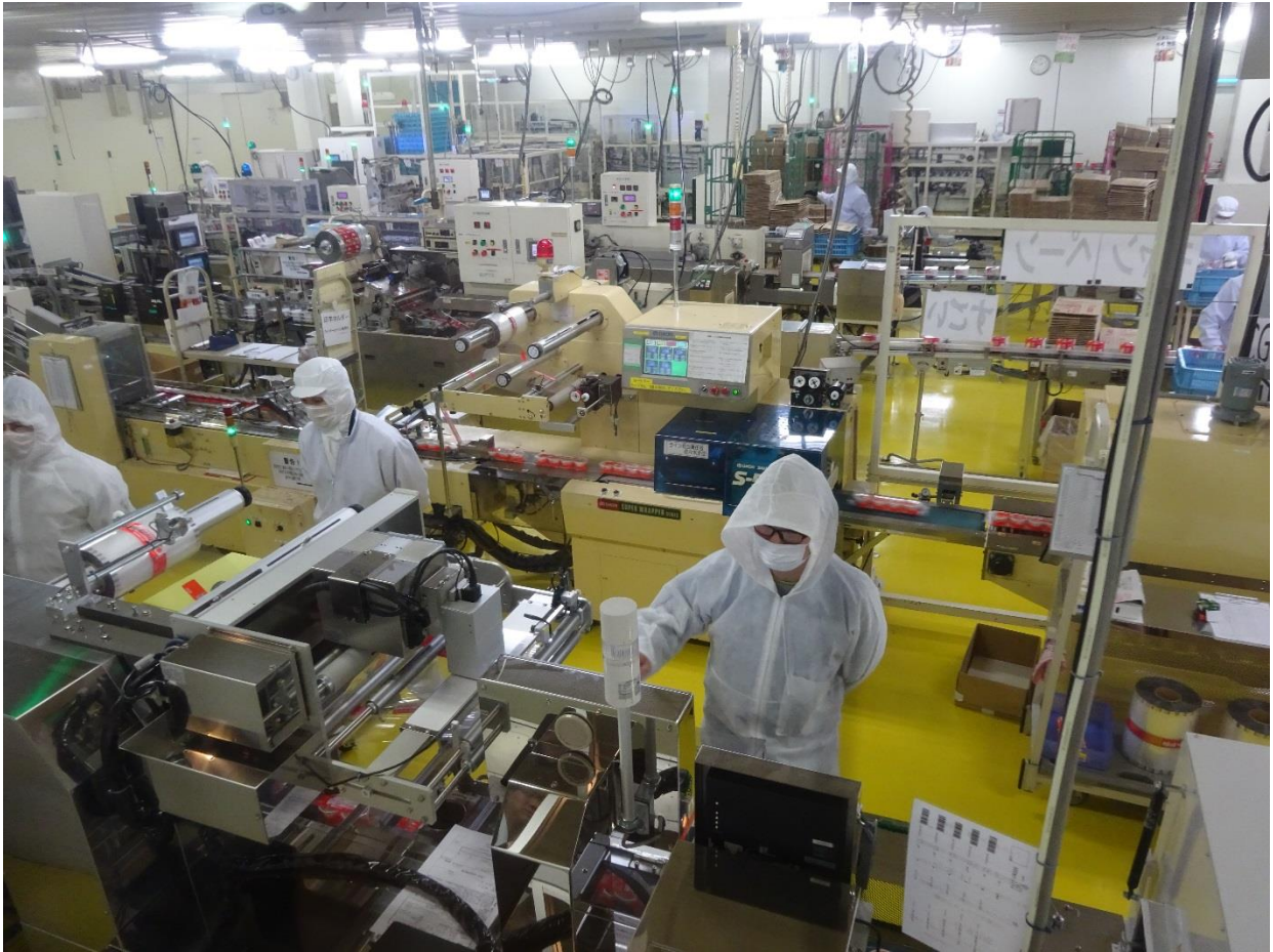
– завод по производству натто г.Юни